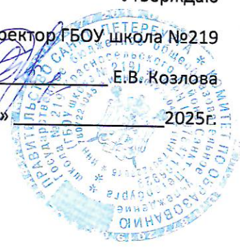
График работы столовой

Приказ № _____ от « _____ » _____ 2025г.